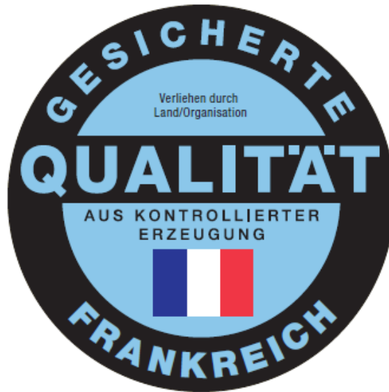
Qualitätszeichen am Beispiel Frankreich